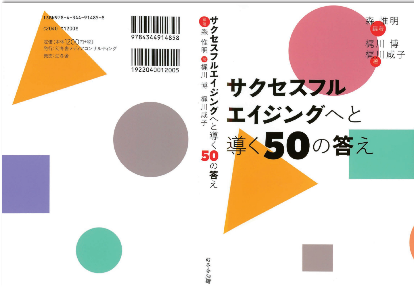
■「サクセスフルエイジングへと導く50の答え」表紙+背+裏表紙

Facebook https://www.facebook.com/morikoreaki?ref=tn_tnmn