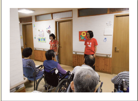
昔懐かしい紙芝居をご覧になられて、穏やかな表情をされていました。又、季節に合った歌を唄い季節感を感じられました。