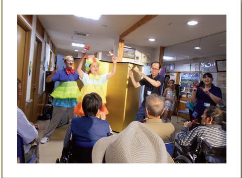
以前は入居者様と職員のための観覧でしたが今回、入居者様の家族様も誘い共に楽しめました。又、家族様や、職員も舞台上に立ち盛り上がりました。