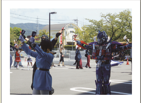
島津病院駐車場にて、入居者様と職員で「近畿大学高知県人会」の踊りを観覧しました。歌に合わせて口ずさんだり、足でリズムをとったりと踊りを楽しめました。